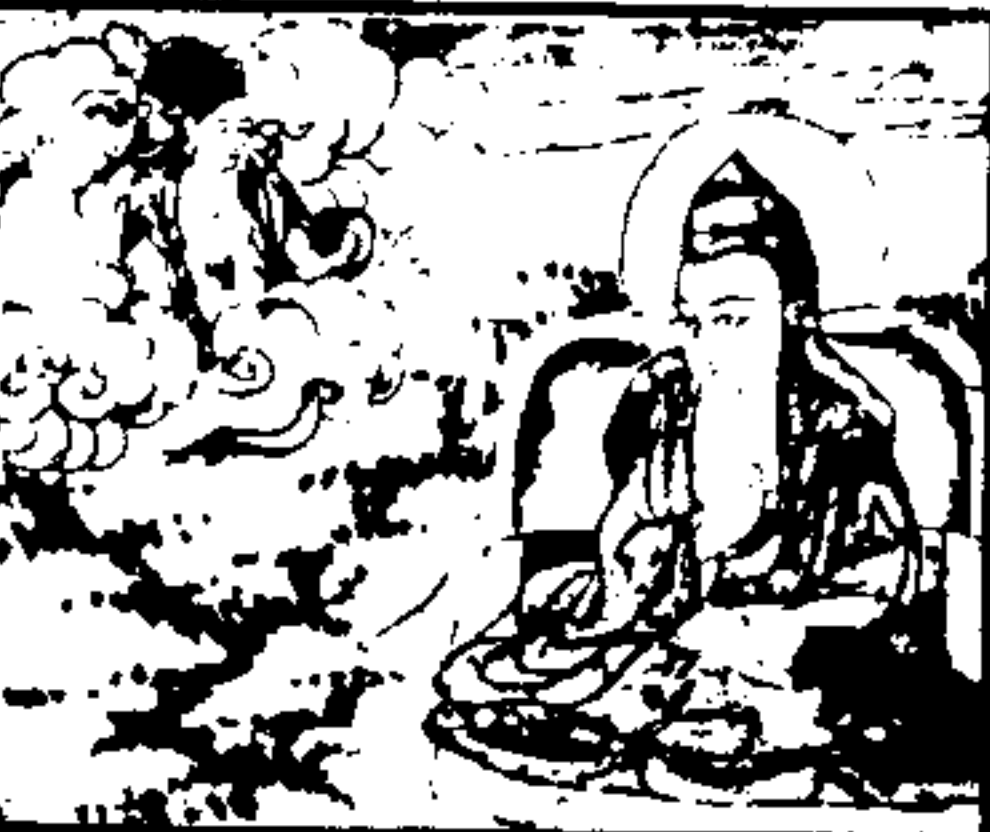
श्रुदवेवदवकेववे । । ववपयेवशायेवेदपयमी । । वदश्रुदनुदपहृगकुरुदगशीना । । श्रुदवेवपयशादश्रुवठेवृवना

ॐ । श्रुदवेवदवकेववे । । ववपयेवशायेवेदपयमी । । वदश्रुदनुदपहृगकुरुदगशीना । । श्रुदवेवपयशादश्रुवठेवृवना नदगकुरुमसाश्रुयेवदवदनुद । । श्रु । श्रुदगगामेददमकंरके । । ठेयगनुदनावनादेनाश्रुददेवृवनामवेवददप्रयवना वीशठमवगनीनामवेवदश्रुवप्रमसाठदगनीनामवेदश्रुगठवृवना । । गनीनामवेदश्रुवददप्रयवना । । देवेवददप्रयवना नुगनावनाश्रुनाप्रमसाठदवददश्रुगठवृवनामवेवददप्रयवना । । देवेवददप्रयवना । । देवेवददप्रयवना वना । । गनुदवेवपयशादश्रुवठेवृवनामवेवददप्रयवना । । देवेवददप्रयवना । । देवेवददप्रयवना